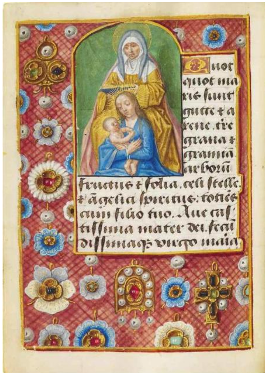
Anna te drieën Imhof Gebedenboek Nederland, Europa